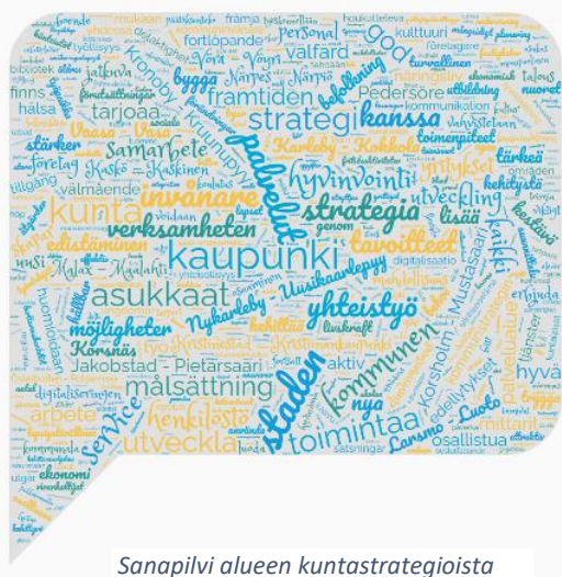
Sanapilvi alueen kuntastrategioista

Kokonaisvaltaisessa ja kestävässä maaseudun kehittämisessä tärkeimmät kumppanit ovat alueen kunnat ja kaupungit, Pohjanmaan ja Keski-Pohjanmaan liitot sekä Pohjanmaan ELY-keskus. Näiden toimijoiden kanssa rakennetaan yhdessä kestävää tulevaisuutta Pohjanmaan rannikkoseudun maaseutualueille ja aktivoidaan alueen yrityksiä ja yhdistyksiä mukaan aluekehittämiseen.