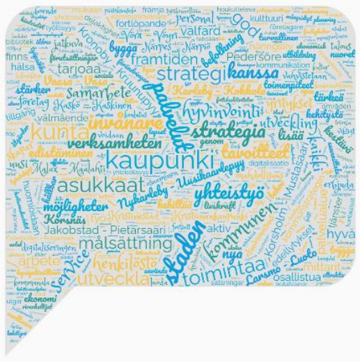
Ordmoln på basen av områdets kommunstrategier

Med tanke på det övergripande och hållbara utvecklandet av landsbygden består de viktigaste samarbetspartners av kommunerna och städerna i området, Österbottens och Mellersta Österbottens förbund samt NTM-centralen i Österbotten. Tillsammans med dessa aktörer byggs en hållbar framtid i landsbygdsområdena i Österbottens kustregion. Samtidigt aktiveras företag och föreningar i området att delta i regionutvecklingen.