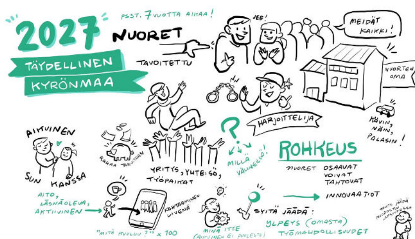
Kuva2. Nuorten näkökulma osallistavaan työskentelyyn vuonna 2027. Tussitaiturit

Tavoitteena on vahvistaa alueen elinvoimaisuutta, yhteisöllisyyttä ja viihtyvyyttä. Kehittäminen rakentaa maaseutuasumisen kokemuksia, kylä-, harrastus- ja yhteistoimintaa sekä turvallista ja viihtyisää elinympäristöä. Positiiviset kokemukset vahvistavat Kyrönmaan identiteettiä ja uudistumista.