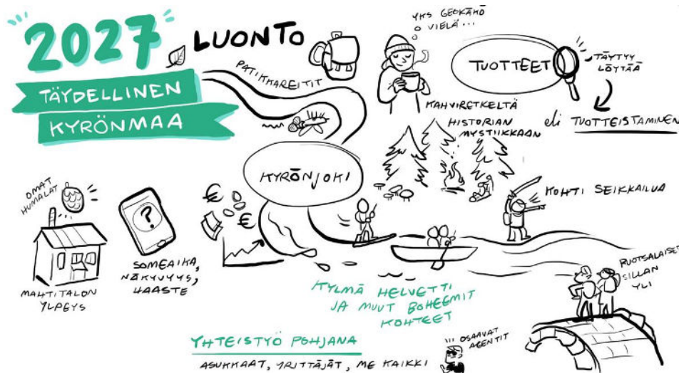
Kuva. Yhteistyö luontoarvojen hyödyntämisessä vuonna 2027. Tussitaurit

Kyrönmaata kehitetään sillanrakentajana kahden maakunnan alueella yritysten ja yhdistysten, kuntien, kylien ja oppilaitosten välillä. YHYRES ry välittää alueen tarpeita ja kumppaneita yhteiskehittämiseen ja toimii aktiivisena innovaatiokumppanina erityisesti kestävien energian, bio- ja kiertotalouden ratkaisujen kehittämisessä ja hyödyntämisessä. Yhteistyötä edistetään uusilla toimintatavoilla, ideoilla ja innovaatioilla esimerkiksi tarjoamalla harjoittelupaikkoja, siirtämällä hiljaista tietoa ja vahvistamalla yrittäjyyskulttuuria. Innovoinnissa ja osaamisen kehittämisessä hyödynnetään Vaasan ja Seinäjoen korkeakouluja ja yliopistoja. Kyrönmaata kehitetään ketteränä kokeilualustana, joka kumpuaa alueen historiasta kauppapaikkana, teollisuus- ja maatalousalueena. Alueen toimijoiden ja ihmisten muutosjoustavuuden kehittäminen vastaa toimintaympäristön kiihtyvään muutostahtiin. Näin uudistetaan liiketoiminta- ja innovaatioekosysteemejä