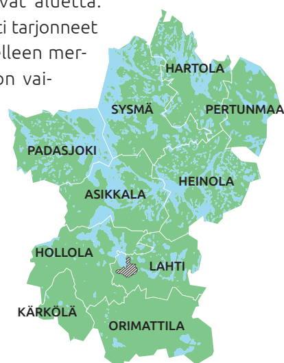
Kuva 2. Päijänne-Leader ry:n toiminta-alueen kartta.

120 000 asukkaan kaupunki tarjoaa etenkin läheiselle maaseudulle