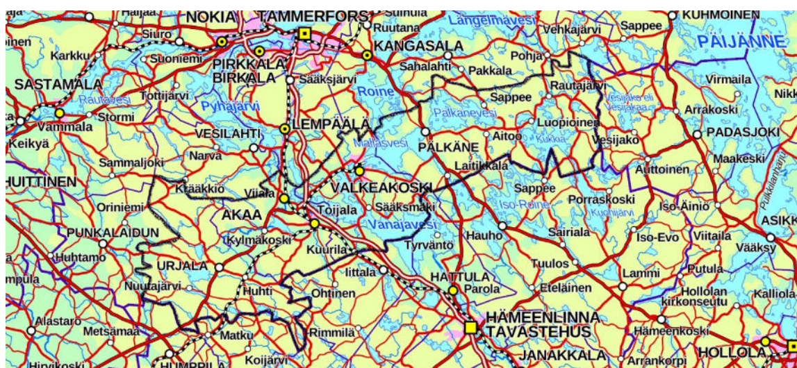
Toiminta-alue merkittynä kartalle.

kun paavi Benedictus XII julisti vuonna 1340 sääksmäkeläisiä talonpoikia pannaan. Alueella on erittäin kaunis luonto ja rikas menneisyys. Maata alueella on alettu viljellä noin 1500-luvulla ennen ajanlaskun alkua ja alue olikin pysyvästi asutettu jo kansainvaelluksen aikoihin 400–800-luvuilla. Rautakaudelta on tehty runsaasti arkeologisia löytöjä. Alueen kaikki peltoviljelyyn sopiva maa on otettu käyttöön viimeistään 1100-luvulla.