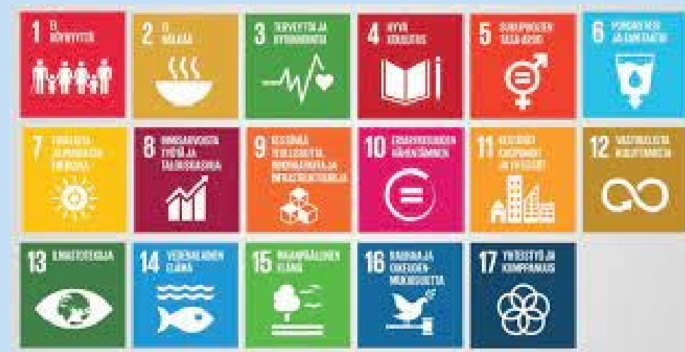
YK:n kestävä kehityksen tavoitteet –Agenda 2030