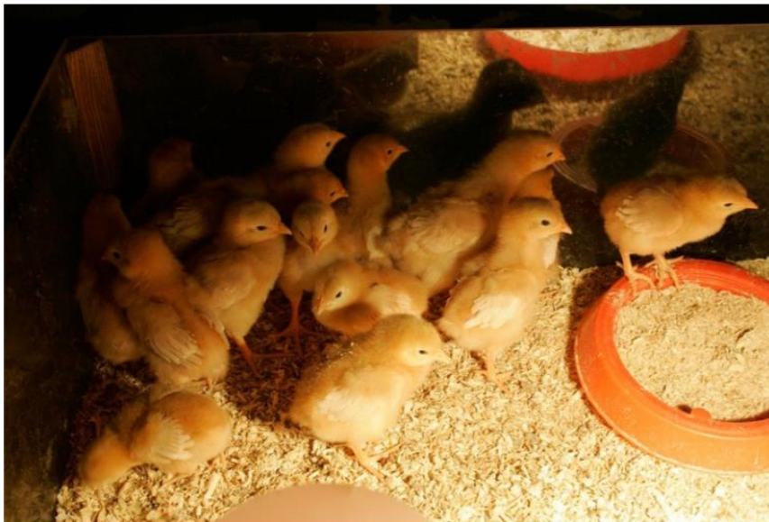
Salmonellatartunnat ovat Suomessa harvinaisia. Kuvituskuva.

Salmonella aiheuttaa yksin Yhdysvalloissa yli 1,2 miljoonan tartuntaa vuosittain. Riskin takia yhdysvaltalaiset kananmunat klooripestaan ja säilytetään jääkaapissa. Suomessa ihmisten salmonellatartunnat ovat pääasiassa peräisin ulkomailta.