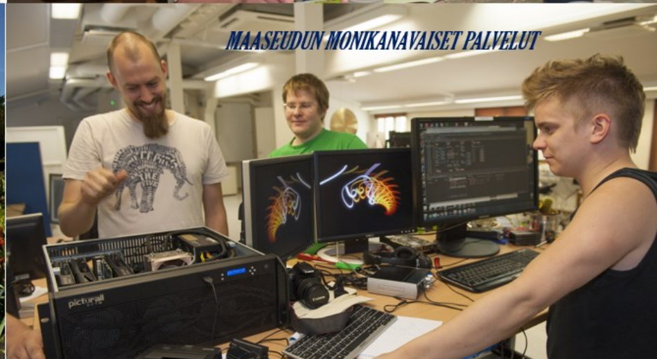
MAASEUDUN MONIKANAVAISET PALVELUT