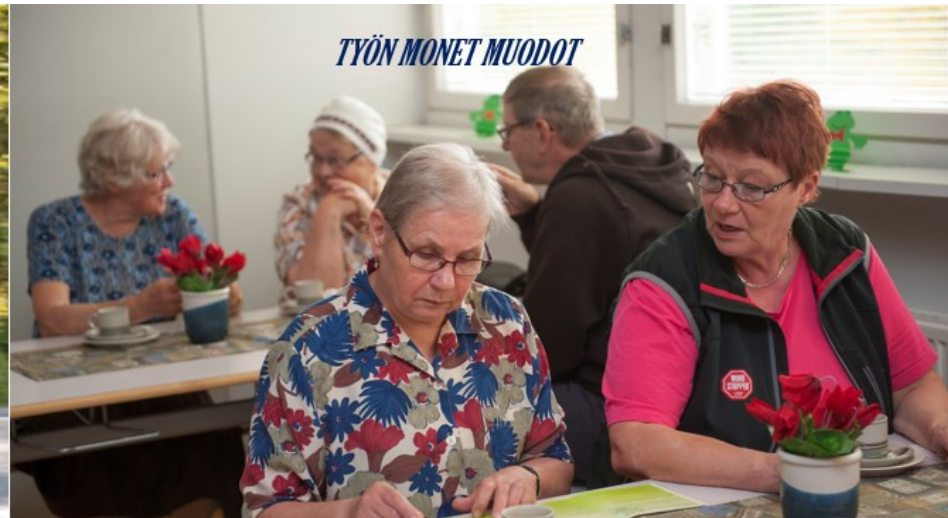
TYÖN MONET MUODOT