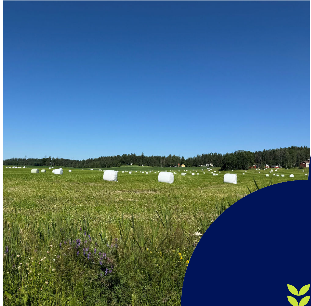
PALLEROT PELLOLLA