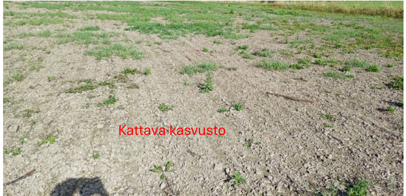
Riistapelto elokuun lopussa; kylvetty, mutta ei havaittavissa kasveja.

Valtioneuvoston asetuksen 77/2023 (ns. yleisvna) 6 § mukaan Kasvinviljelyyn liittyväksi maataloustuotteiden tuottamiseksi katsotaan viljely maatalousmaalla, jossa yksi- tai monivuotinen kasvusto on perustettu kylvämällä tai istuttamalla riittävällä siemen- tai taimimäärällä viimeistään 30 päivänä kesäkuuta, tarkoituksena tuottaa korjuu- ja markkinakelpoinen sato tai tarkoituksenmukainen ilmasto- tai ympäristöhyöty. ... Jos poikkeukselliset sääolosuhteet estävät kylvämisen tai istuttamisen viimeistään 30 päivänä kesäkuuta, kylvö tai istutus on tehtävä heti olosuhteiden salliessa. Poikkeuksellisenä sääolosuhteena pidetään tilannetta, jossa pitkään jatkuneiden runsaiden sateiden ja vähäisen haihdunnan vuoksi pellon märkyys on estänyt kylvämisen.